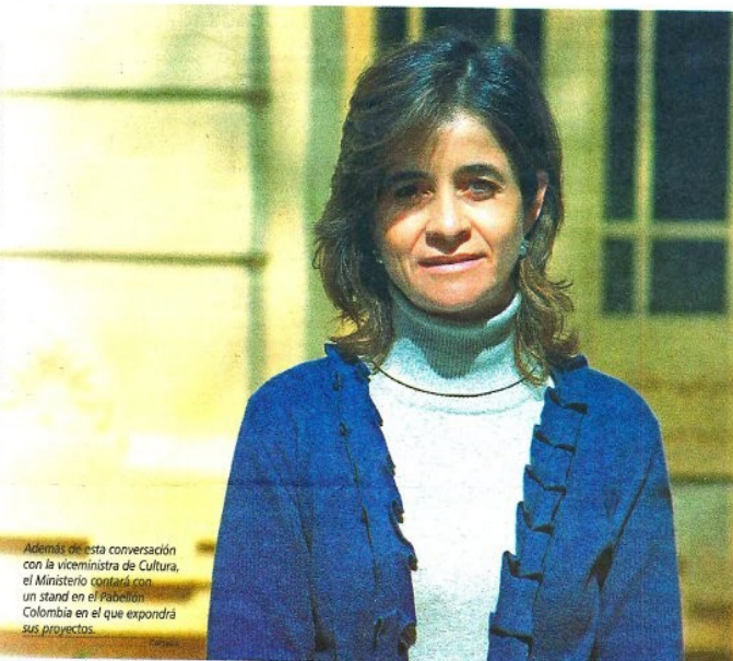
Además de esta conversación con la viceministra de Cultura, el Ministerio contará con un stand en el Pabellón Colombia en el que expondrá sus proyectos.

Colombia", que tendrá lugar el próximo miércoles, de 2.00 a 4.00 p.m., en la Sala Seis del Pabellón Amarillo de Plaza Mayor.