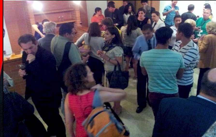
Invitaciones le 9 et le 10 avril à l'Alliance Française