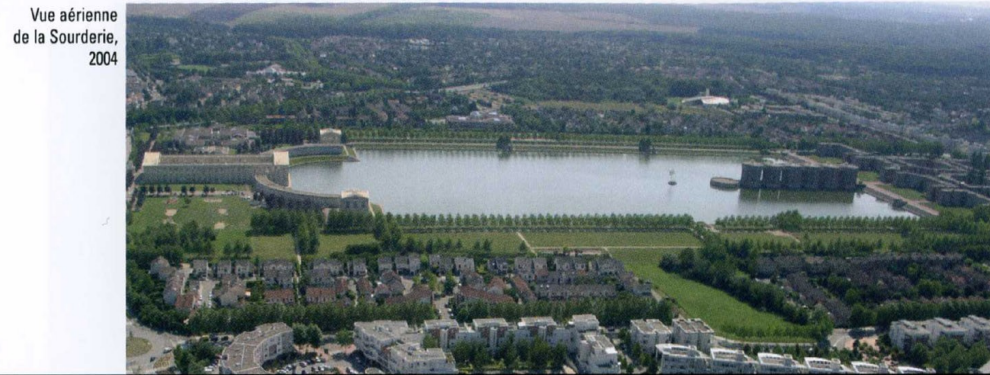
Vue aérienne de la Sourderie, 2004