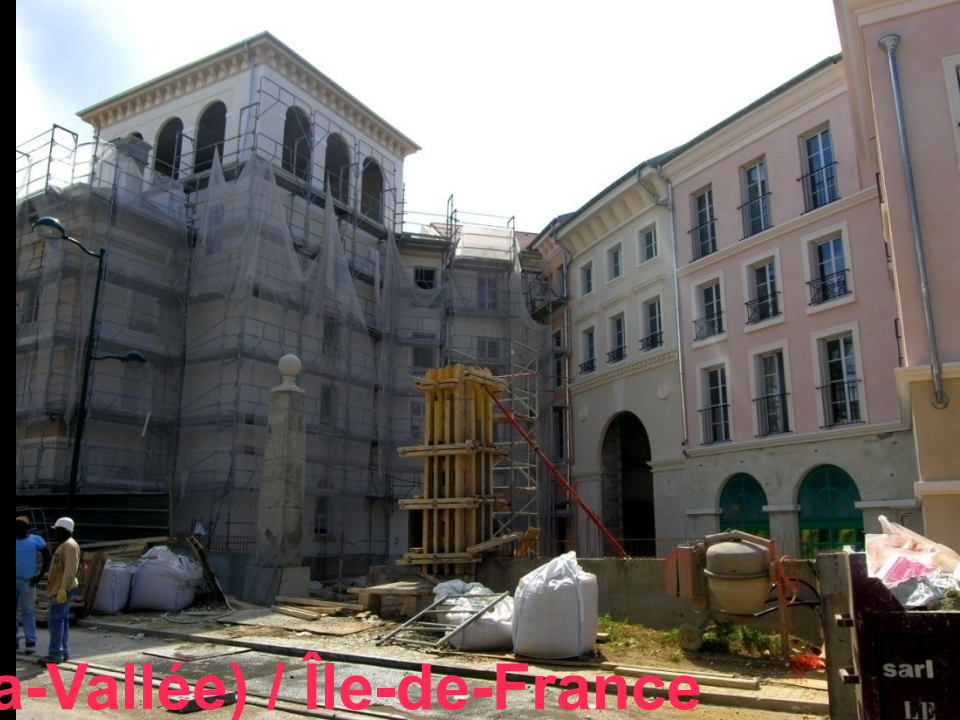
Quartier Val-d'Europe (Marne-la-Vallée) / Île-de-France