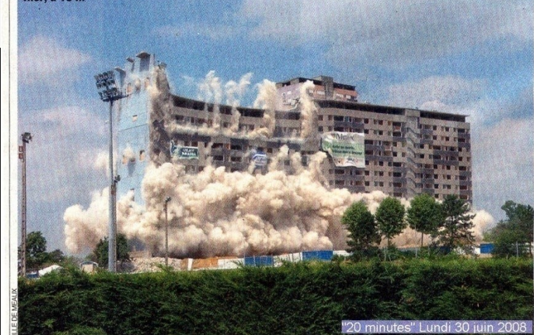
"20 minutes" Lundi 30 juin 2008

Elle avait poussé à Meaux (Seine-et-Marne) dans les années 1960, mais hier à 13 h, la barre Fougère a tiré sa révérence. Ce bâtiment de quinze étages, qui comprenait soit 500 logements dans un rayon de 200 m, ont été évacués pendant l'opération, qui a nécessité 215 kg d'explosifs, 1 030 détonateurs et la participation de 400 personnes. avaient déjà été détruits dans les quartiers Beauval et Pierre-Collinet depuis 2004, afin de laisser place à une opération de renouvellement urbain. Habitations résidentiel.