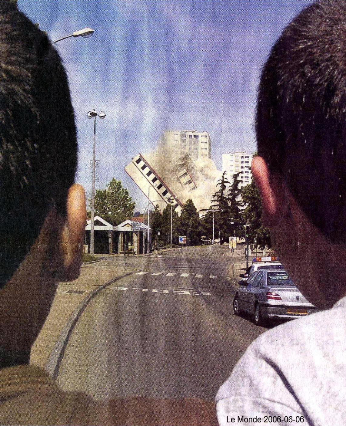
émolition de la tour 44 du boulevard Lénine, à Vénissieux (Rhône), en 2004.