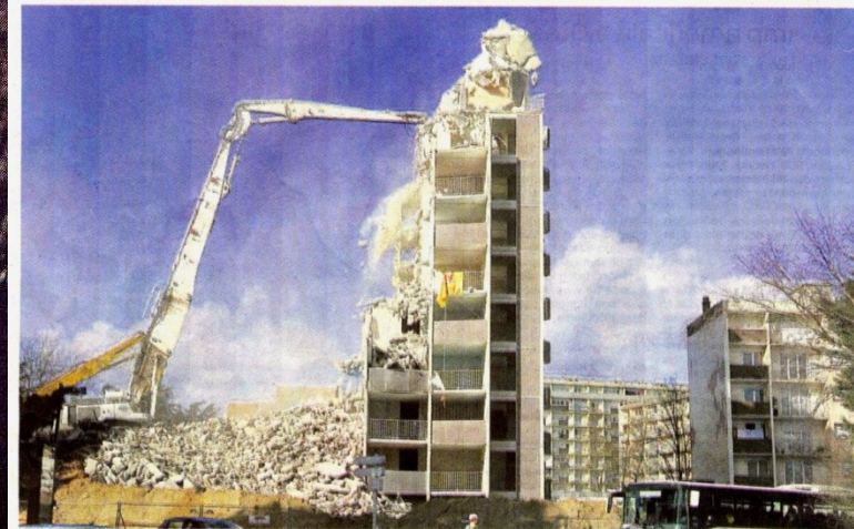
La destruction de la tour de l'île de Man: symbole du renouvellement urbain de Kermoyan. De nouvelles destructions, et des reconstructions, sont prévues.

A la fin de l'année prochaine, cent cinquante logements seront détruits. Quarante-vingt-cinq familles sont déjà relogées.