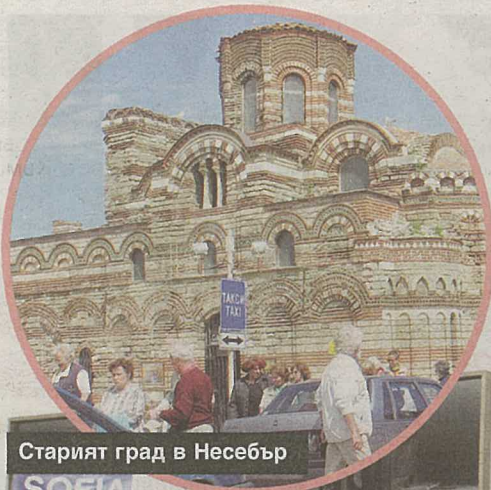
Старият град в Несебър

и ще финансира до 70% от пазарната стойност на