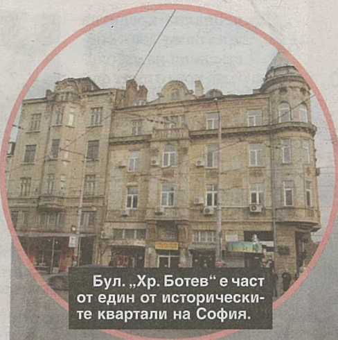
Бул. „Хр. Ботев“ е част от един от историческите квартали на София.