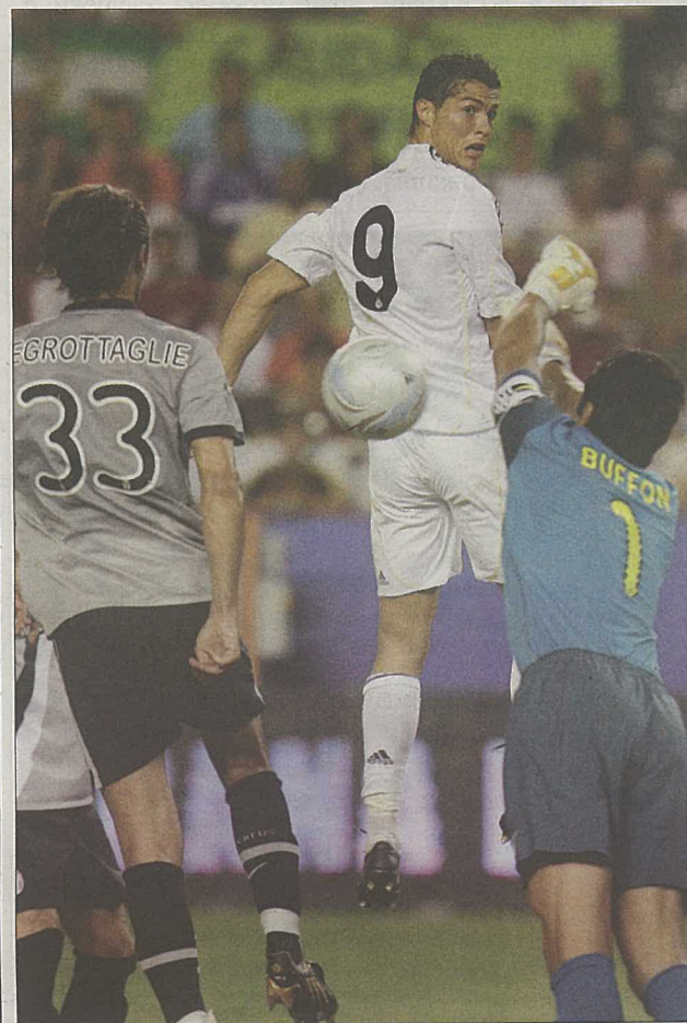
Кристиано Роналдо ще се опита да не развали традицията и отново да вкара на Буфон.

Ако Роналдо и съотборниците му вкарат поне гол в съботния финал, те ще направят „Реал“ първия отбор в Шампионската лига, отбелязал 500 попадения. Следващият „Барселона“ има едва 459. (24 часа)