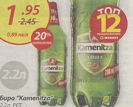
Бира „Kamenitza“ 2.2л, PET