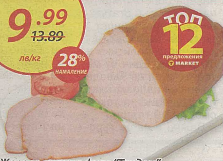
Жарено свинско филе „Тандем“ кг