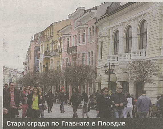
Стари сгради по Главната в Пловдив