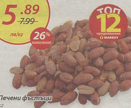
Печени фъстъци кг